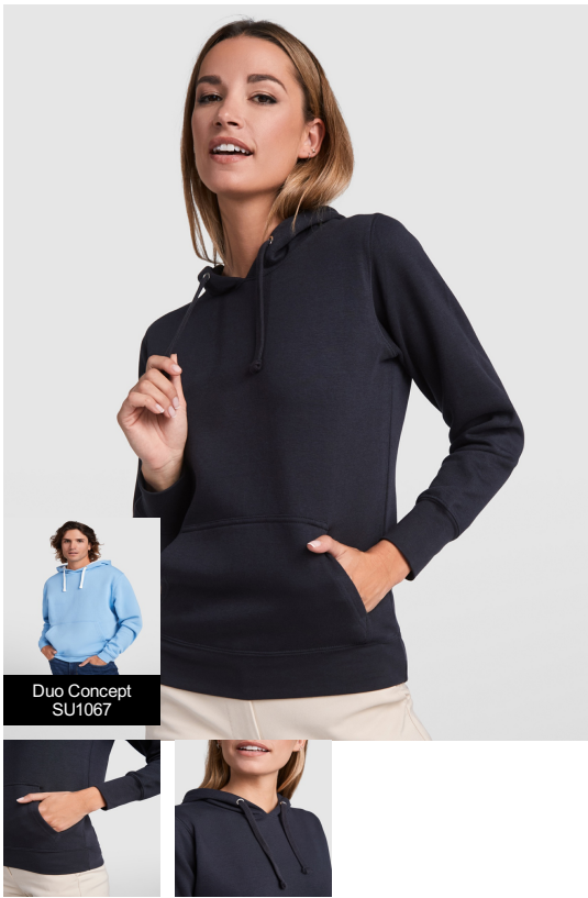
Duo Concept SU1067