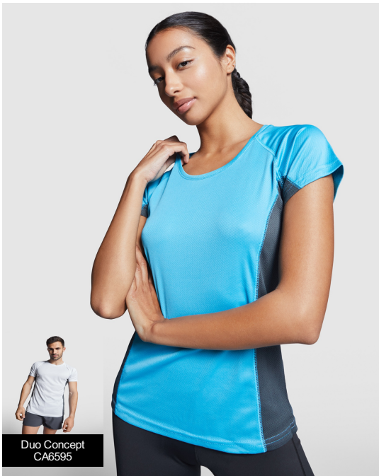
Duo Concept CA6595