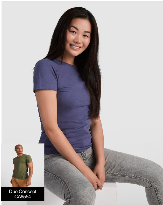
Duo Concept CA6554