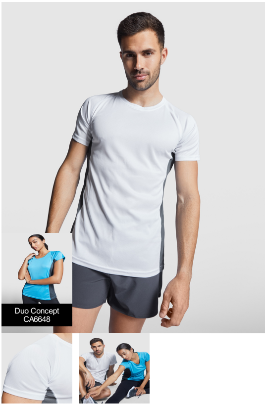
Duo Concept CA6648